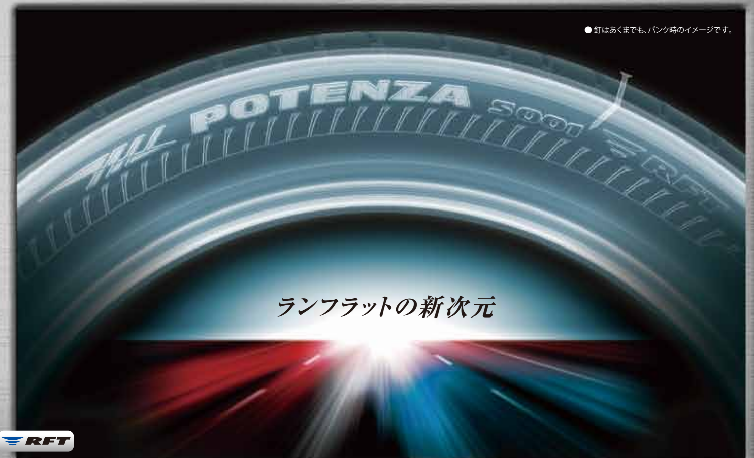
●釘はあくまでも、パンク時のイメージです。